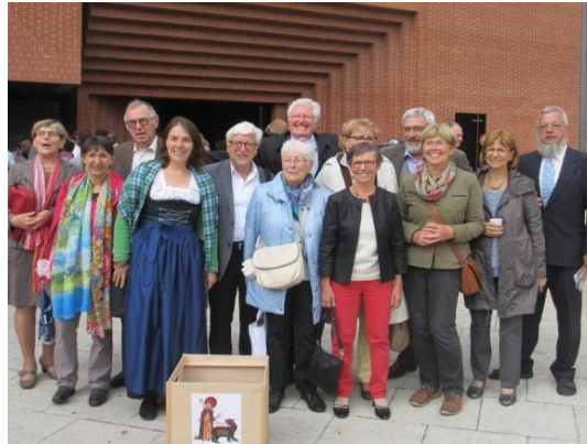
Gruppenbild von PaG und Commission 2016 vor der Kathedrale in Évry