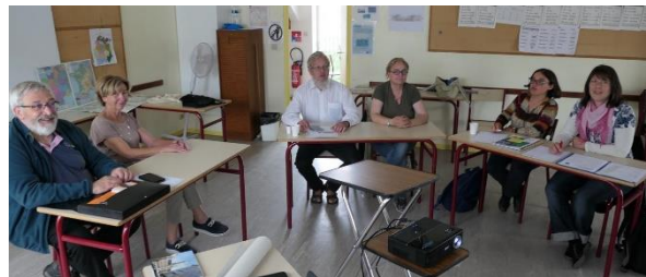
Austausch der Partnergruppen im Pfarrheim von St. Clément in Arpajon/Frankreich