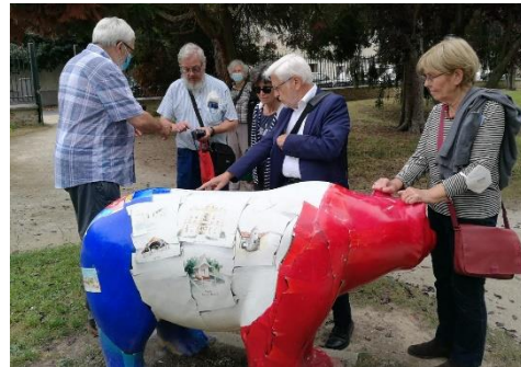
Gruppengespräch am Korbiniansbär in Arpajon/Frankreich